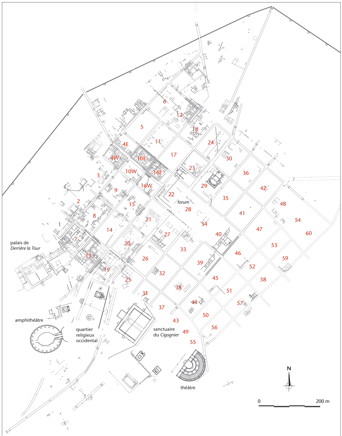
Fig. 1 Extrait du plan archéologique d'Aventicum (état 2008) avec la numérotation des insulae.