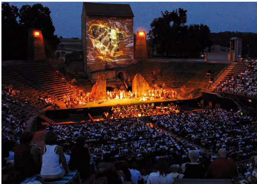
Fig. 31 – « Lucia di Lammermoor » au 16 e Festival d'opéra