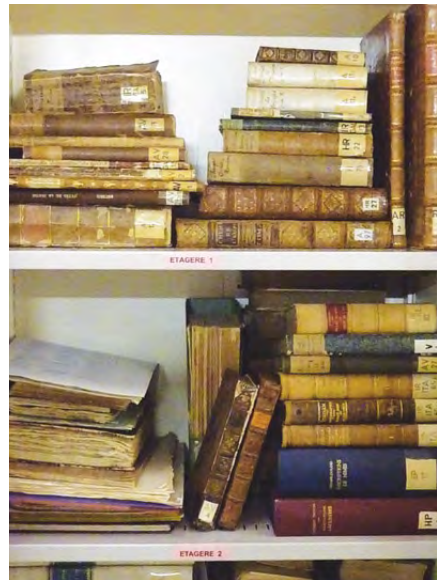
Fig. 8 – Ces ouvrages rares méritent qu'on leur réserve un conditionnement adapté à leur grand âge, objectif qui figure sur la liste de nos priorités pour la bibliothèque

activités culturelles (SERAC) a pris la décision d'intégrer le consortium des bibliothèques romandes RERO au mois d'octobre 2010 et ce dernier a confirmé cette intégration au mois de décembre 2010. Il s'agit là d'une décision historique et extrêmement importante pour notre site, dont la bibliothèque spécialisée en archéologie et histoire antique sera, dans un proche avenir, présente sur Internet, accessible sur le catalogue de RERO < http://meta.rero.ch/ >, mais aussi sur une plateforme mondiale comme celle de Worldcat < http://www.worldcat.org/ >.