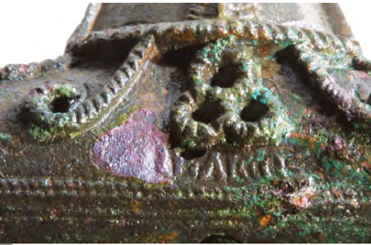
Fig. 16 – Minuscule marque d'artisan (LITAICCOS) sur la gaine décorée d'une fibule en bronze mise au jour dans le cimetière d'Avenches-À la Montagne

Plusieurs ensembles de peintures murales du palais de Derrière la Tour ont été mis sur panneau. Deux d'entre eux ont été présentés dans l'exposition temporaire « Palais en Puzzle ». Réalisés par Alain Wagner, ces travaux sont publiés en détail dans le BPA , avec une contribution de Sophie Bujard 6 . Ils ont en outre été présentés à l'occasion du 24 e séminaire de l'Association française pour l'étude de la peinture murale antique à Narbonne (novembre 2010).