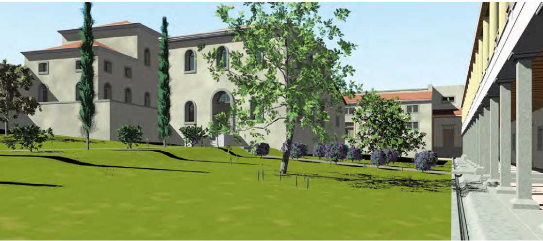
Fig. 23 – Vue partielle du palais de Derrière la Tour restituée par informatique