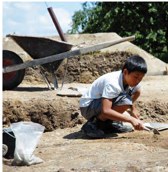
Fig. 21 – L'un des jeunes participants aux fouilles ouvertes au public en été 2010 sur le site du palais de Derrière la Tour

En mars tout d'abord, la découverte d'un puits du 17 e s. dans le cadre de la rénovation de la place de l'Église (fig. 19) 2 , une intervention d'urgence d'un type particulier – le puits