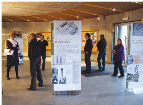
Fig. 5 – L'exposition du 125 e anniversaire de l'Association Pro Aventico dans l'aula du Cycle d'Orientation de Domdidier

La Foire aux Ateliers du Musée de Vallon s'est tenue le dimanche 26 septembre 2010. Depuis plusieurs années, le Musée romain d'Avenches y est invité, tout comme d'autres musées suisses, et propose un atelier destiné aussi bien aux adultes qu'aux enfants. En 2010, les activités proposées tournaient autour des thèmes de l'écriture et du calcul. Concernant l'écriture, nous avons repris l'activité mise sur pied pour la Mustermesse de Bâle en 2009 5 , consistant à traduire ou à faire traduire le prénom des participants en gaulois. Petits et grands ont également pu s'exercer à écrire à l'encre avec une plume de roseau ou sur une tablette de cire avec un stylet. Pour le calcul, chacun a pu tester ses connaissances à