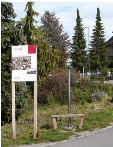
Fig. 4 – Panneau explicatif et stéréoscope à l'emplacement du palais de Derrière la Tour dans le cadre de l'exposition temporaire « Palais en puzzle »

Barcelone (E), Centro de Cultura Contemporània de Barcelona, 26 juillet 2010 – 16 janvier 2011, « Per Laberints » :