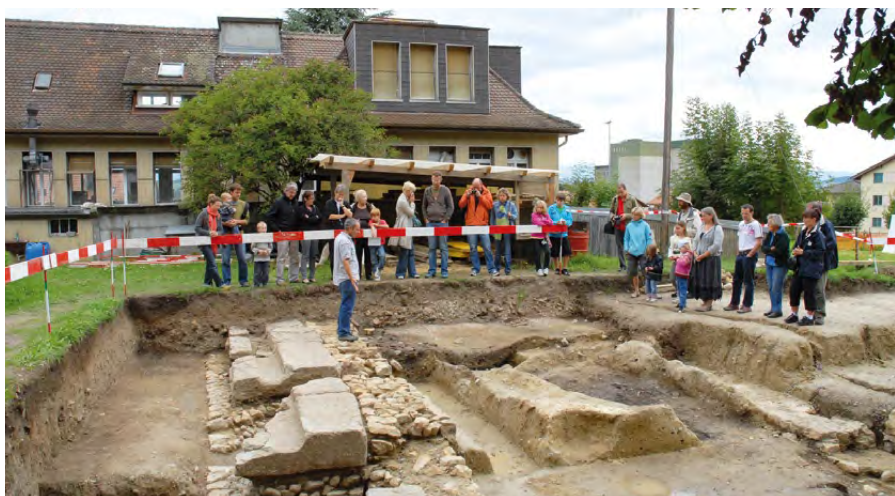
Fig. 22 – Journée portes ouvertes sur les fouilles du palais de Derrière la Tour

de la phase publique de ces fouilles (fig. 22). L'équipe de fouilles a également élaboré un balisage du site de Derrière la Tour sous la forme d'une série de panneaux signalant le lieu des principales fouilles et découvertes en relation avec l'édifice. Volet extérieur de l'exposition temporaire « Palais en puzzle », ces panneaux, complétés par trois stéréoscopes permettant de visualiser en 3D et sous forme d'images de synthèse, différents secteurs du palais, ont servi de support à de nombreuses visites guidées in situ .