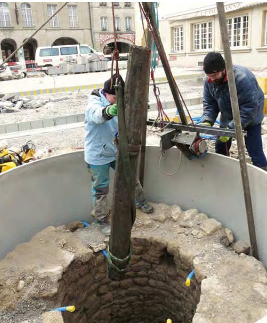
Fig. 20 – Prélèvement d'un élément d'une conduite de pompage en bois avec l'aide de membres du Spéléo-Club du Nord-Vaudois

atteignait 16 m de profondeur – qui a nécessité l'engagement de plusieurs membres du Spéléo-Club du Nord Vaudois (fig. 20). Cette opération a bénéficié du soutien des autorités locales qui en ont assuré une part du financement. Le puits est aujourd'hui mis en valeur sur la place de l'Église entièrement rénovée. L'étude du mobilier récolté devrait être confiée à des spécialistes de cette période.