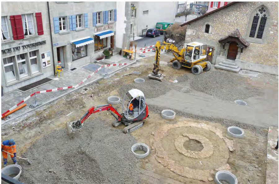
Fig. 19 – Le puits de la place de l'Église au moment de sa découverte en mars 2010