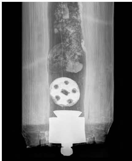
Fig. 14 – Les éléments du dispositif de pompage encore en place dans le tuyau ont pu être observés grâce aux analyses par rayons X effectués à l'hôpital de Payerne

commune d'Avenches à modifier ses plans, en vue de conserver la partie centrale de ce puits pour une présentation au public. Les travaux de consolidation et de restauration des maçonneries ont été effectués par Édouard Rubin (fig. 12).