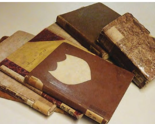
Fig. 7 – Exemples d'ouvrages précieux que l'on pourra trouver dans les catalogues du réseau romand RERO, sur Internet

Le chantier le plus important dans le domaine bibliothéconomique, en termes de changement, est la reprise du projet Biblioser en vue de l'harmonisation de la gestion des bibliothèques des musées cantonaux (sur la base du document « Analyse de l'existant », élaboré entre 2006 et 2009). Le Service des