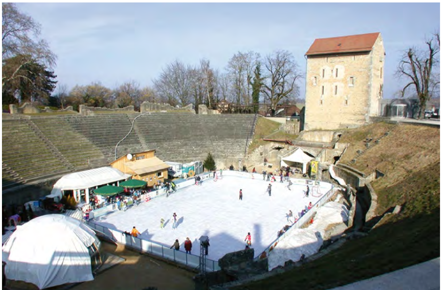
Fig. 30 – Aventicum on Ice

Pour marquer son anniversaire par une opération spectaculaire, l'Aéroclub a procédé à l'envol de ballons à air chaud, parfois assez acrobatique, depuis le fond de l'arène.