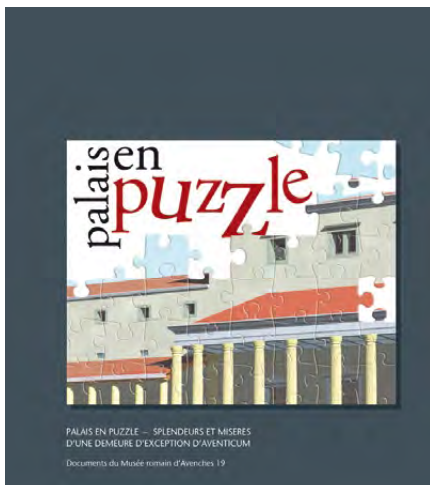
Fig. 25 – Palais en puzzle – Splendeurs et misères d'une demeure d'exception d'Aventicum

Pierre Blanc, Daniel Castella, Sophie Delbarre-Bärtschi, Palais en puzzle. Splendeurs et misères d'une demeure d'exception d'Aventicum . Livret d'accompagnement de l'exposition temporaire ( Documents du Musée romain d'Avenches 19), Avenches, 2010 (fig. 25).