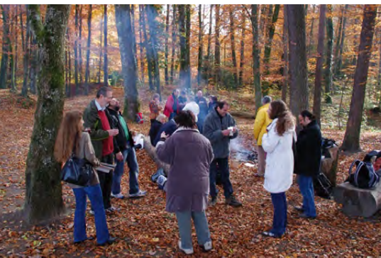
Fig. 1 – L'équipe du Site et Musée romains d'Avenches en excursion au Bois-de-Châtel le 3 novembre 2010