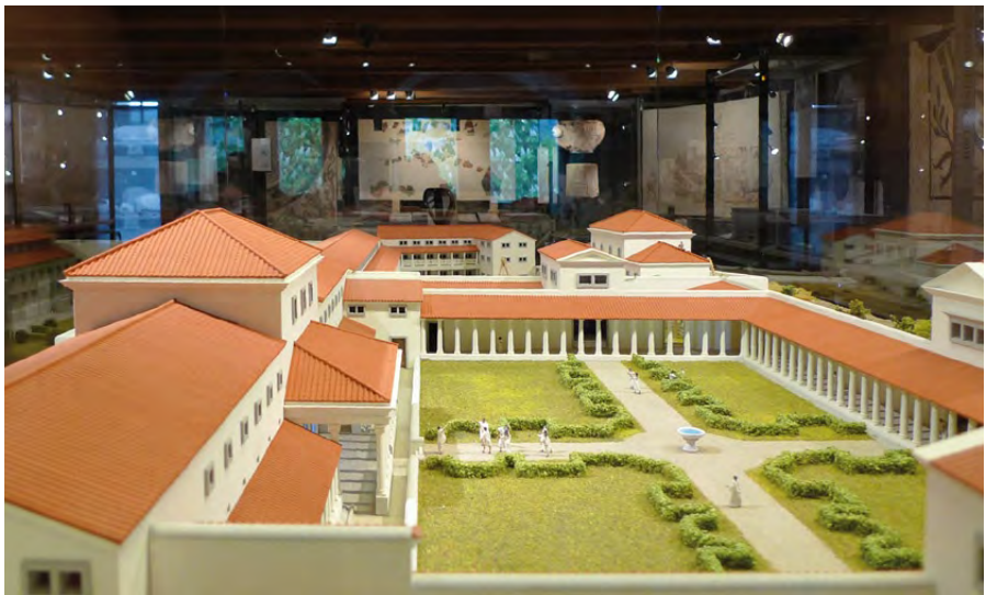
Fig. 3 – L'exposition temporaire « Palais en puzzle ». Au premier plan, la maquette du palais de Derrière la Tour (réal. H. Lienhard)

Divers instruments médicaux, tablette magique en plomb ( defixio ), ossements humains présentant des séquelles de pathologies et copie de l'inscription dédiée aux médecins et aux professeurs.