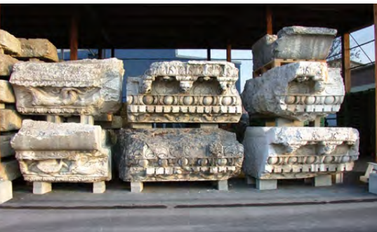
Fig. 2 – Blocs d'architecture du sanctuaire du Cigognier désormais entreposés dans le nouveau dépôt lapidaire

La participation d'Isabella Liggi Asperoni à l'exposition commémorant les 125 ans de la création de l'Association Pro Aventico a