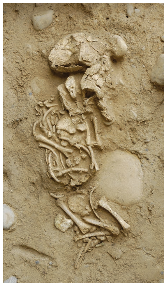
Tombe de nouveau-né. Cimetière d'À la Montagne. 1 er s. apr. J.-C.

Faute de textes, notre connaissance du traitement funéraire des enfants dans la société gallo-romaine repose en premier lieu sur les données livrées par la fouille des cimetières antiques. De fait, les sépultures infantiles mises au jour sont sensiblement moins nombreuses que les tombes d'adultes : ainsi, à Avenches, elles représentent bien moins du quart du total des sépultures. Cela s'explique en partie par la grande fragilité des