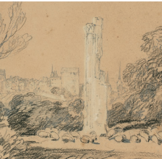
Joseph Mallord William Turner, Avenches, the Town and the Ruined Column, «Le Cigognier» (1802); détail