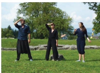
Trois comédiens de la compagnie STOA en représentation au théâtre antique

Comme de coutume lors des Journées du Patrimoine, plusieurs centaines de personnes ont répondu à l'appel en participant aux visites et aux spectacles ou en visitant le Musée.