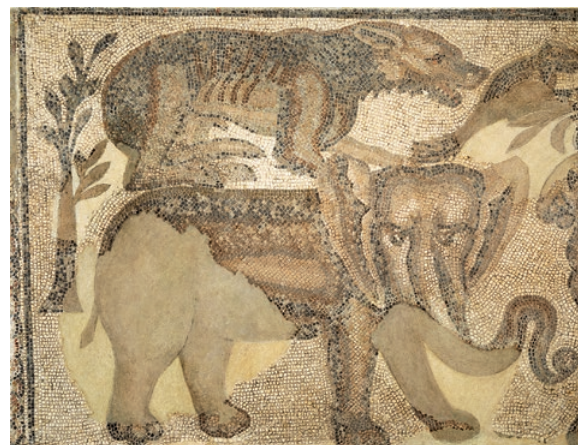
Fragment de la mosaïque d'Orphée découverte en 1793 par Lord Spencer Compton Bernisches Historisches Museum, Bern.

en 1751 eut également un grand retentissement. Un couvert fut construit pour la protéger et permettre de l'admirer. Parmi les premiers visiteurs, François-Marie Arouet (1694-1778), mieux connu sous le nom de Voltaire, s'est rendu sur les lieux probablement vers 1755, alors qu'il séjournait à Lausanne. Son bref témoignage nous apprend que cette mosaïque « n'est point dégradée », constat qui ne sera plus partagé par Johann Wolfgang von Goethe (1749-1832), de passage à Avenches en 1779 et qui écrira à son amie Charlotte von Stein « Vu à Avenches un pavement en mosaïque de l'époque des Romains, pavement chaque jour ruiné davantage, ce qui est lamentable ».