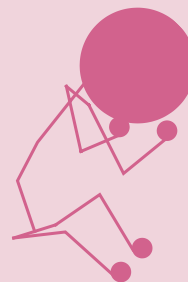
Sépulture de nouveau-né du cimetière découvert en 2016 près de la porte du Nord. L'enfant a été placé en position fœtale dans un fond de récipient en céramique