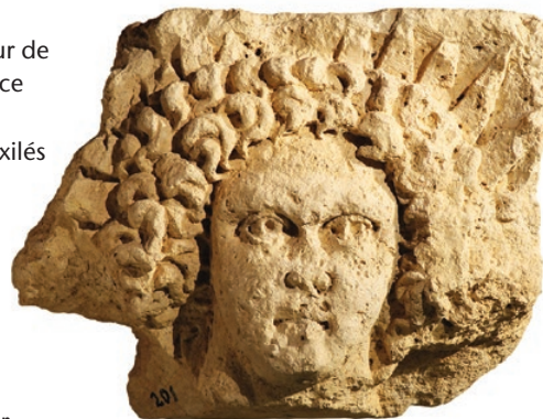
Orthostate à tête de Sol. Il s'agit très certainement de la « tête colossale d'Apollon » mentionnée par Alexandre Dumas

En 1828, l'écrivain américain James Fenimore Cooper (1789-1851) entame un voyage à travers l'Europe avec sa famille. Son périple passera par Avenches, qui lui inspirera également ces quelques lignes : « Près de la ville moderne s'élève une solitaire colonne corinthienne haute de quarante pieds; un nid de cigogne reposait au sommet; du grain encore vert