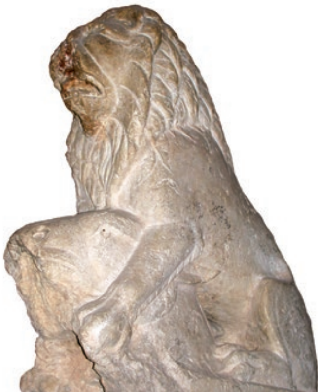
Sculpture en calcaire blanc mise au jour à Avenches en 1786. Un lion assis retient entre ses pattes la tête d'un âne sauvage

l'organisateur des jeux ( editor ) et du public. Au moment précis de décider si le perdant avait effectivement fait preuve de bravoure durant son combat et méritait par conséquent d'être gracié, l'assemblée toute entière s'unissait alors en une véritable communauté. Si la décision tournait en défaveur du vaincu, on le lui signifiait parfois par un signe du pouce en direction du vaincu, le plus souvent cependant par le cri iugula! , « qu'il soit égorgé! ». Des combats pouvaient toutefois s'achever sans qu'aucun des deux gladiateurs ne l'emporte, qu'ils soient contraints, à bout de forces, d'abandonner ou que les spectateurs ou l'organisateur estiment qu'ils méritaient tous deux la victoire par le courage qu'ils avaient montré.