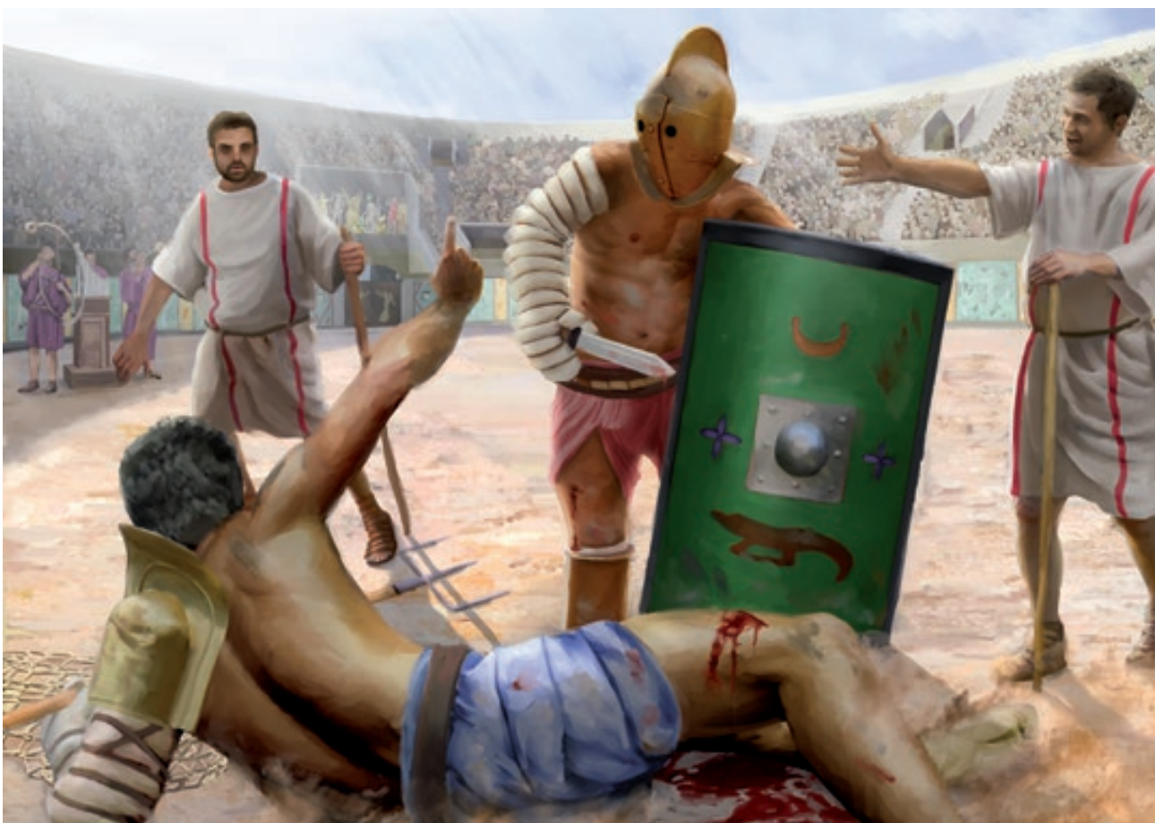
Illustration Philip Bürli, SMRA

Scène de combat dans l'amphithéâtre d'Avenches. Gravement blessé, le rétiaire ( retiarius ) gît sur le sol tandis qu'un des deux arbitres déclare vainqueur son adversaire, un secutor