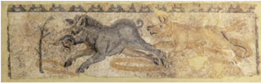
Dans l'arène, un chien pourchasse un sanglier. Mosaïque dite « d'Hercule et Antée » (Avenches, insula 59)

« Un lion perfide avait blessé son maître avec son ingrate gueule, et osé ensanglanter des mains qu'il connaissait si bien : mais il subit la peine que méritait un pareil forfait ; et celui qui n'avait point voulu souffrir une correction légère fut percé de traits. Quelles doivent être les mœurs des hommes sous un tel prince, qui contraint jusqu'aux animaux féroces à devenir plus doux ! »