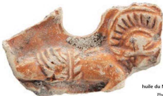
C'est le dénouement final : le gladiateur à terre a été condamné à mort; il git ventre à terre et attend le coup d'épée fatal de son vainqueur. Médaillon d'une lampe à huile du Musée romain d'Avenches

Les Métamorphoses , 4,13. Trad. sous la dir. de D. Nisard, Paris, Firmin Didot, 1865.