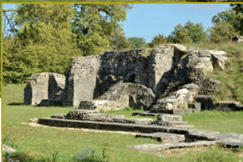
L'extrémité nord des gradins du théâtre avant (ci-contre) et après les travaux de conservation-restauration de 2015