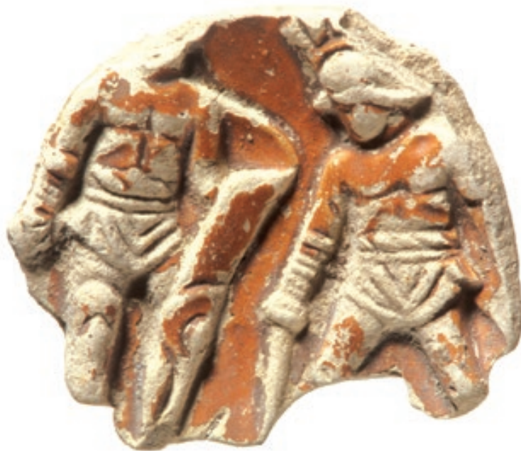
Un vainqueur et un perdant. Cette représentation sur une lampe à huile du Musée romain d'Avenches montre la fin d'un combat : le gladiateur de droite, visiblement touché, a abandonné le combat et baissé son épée; à gauche, le vainqueur attend la décision de l'organisateur et du public d'achever ou non son adversaire