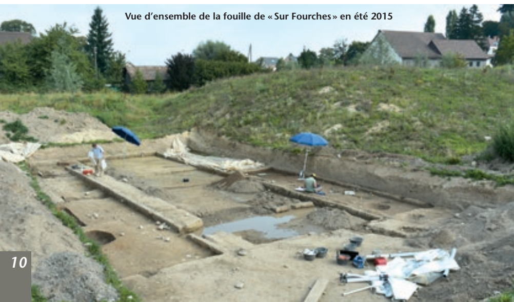
Vue d'ensemble de la fouille de « Sur Fourches » en été 2015