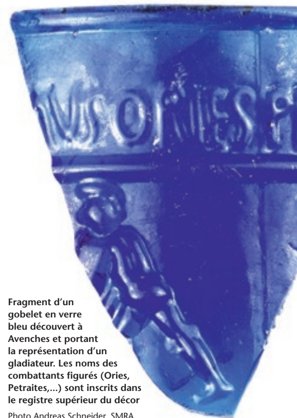
Fragment d'un gobelet en verre bleu découvert à Avenches et portant la représentation d'un gladiateur. Les noms des combattants figurés (Ories, Petraites,...) sont inscrits dans le registre supérieur du décor

Des Spectacles, 19. M. Val. Martial, Épigrammes, tome 1, trad. V. Verger, coll. Bibliothèque latine-française (publiée par C. L. F. Panckoucke), Paris, 1834.