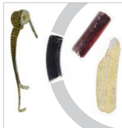
Fibule (broche) en bronze et trois fragments de bracelets en verre caractéristiques de la fin du 2 e et du début du 1 er siècle av. J.-C. Échelle env. 1:1

En comparaison d'autres établissements de cette période de La Tène D1 (150-80 av. J.-C.), le mobilier récolté est abondant et riche. On ne compte pas moins de cinq fibules, un fléau de balance en bronze, ainsi que des fragments de bracelets en verre. La céramique mise au jour comprend majoritairement de la vaisselle commune grise fine locale, ainsi que quelques récipients peints. Les importations sont représentées par de rares fragments d'amphores à vin italiennes et des pots ayant vraisemblable-