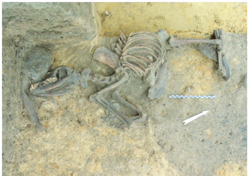
Squelette d'un chien inhumé au fond de l'une des grandes fosses d'époque celtique

Au vu des résultats spectaculaires obtenus lors de cette vaste opération, ce secteur de la route du Faubourg est appelé à devenir un ensemble de référence de première importance pour le 1 er siècle avant notre ère.