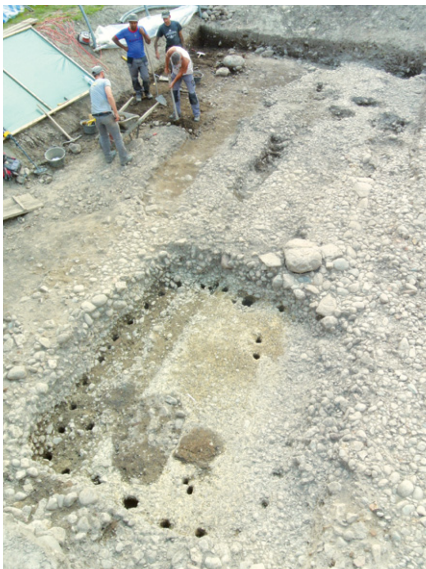
Fond d'une cabane à piquets d'époque médiévale implantée dans les niveaux de la chaussée romaine