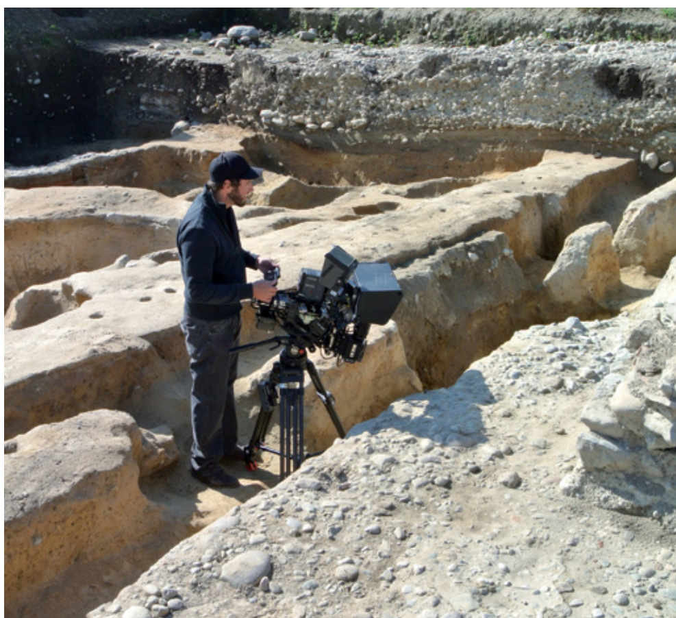
L'équipe de NVP3D Productions a tourné des séquences de film sur la fouille du Faubourg; elle y a aussi réalisé des prises de vue photographiques au moyen d'un drone

Depuis plus d'une vingtaine d'années, les témoins de la présence d'Helvètes dans la plaine aventicenne, dès le début du 1 er siècle av. J.-C. au plus tard, se sont multipliés. Il suffit de rappeler par exemple les quelques sépultures mises au jour dans le quartier religieux occidental ou les grandes fosses-dépotoirs découvertes juste à l'extérieur de la porte de l'Ouest (Sur Fourches). La répartition de ces vestiges, au pied de la colline du bourg médiéval, a fait naître l'hypothèse de l'existence d'un axe de circulation antérieur à l'installation de la ville romaine, axe repris plus tard par la voie principale susmentionnée traversant l'agglomération du sud-ouest au nord-est.