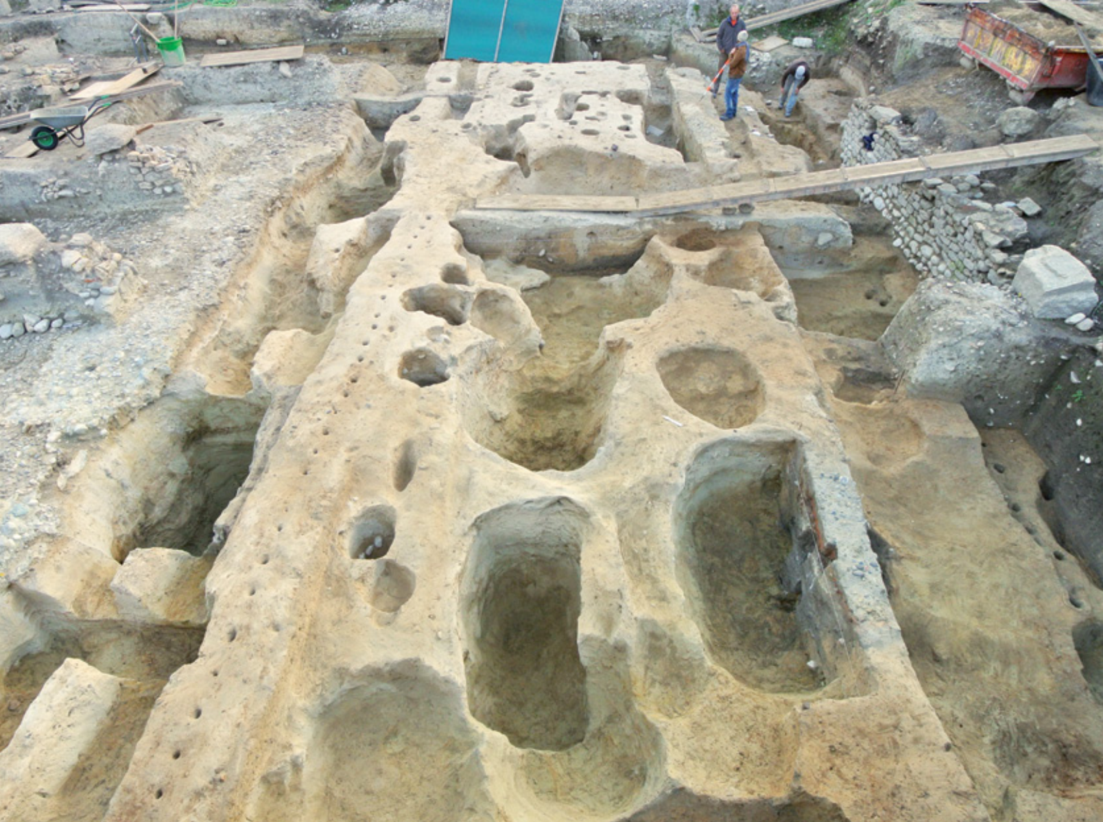
Vue d'ensemble, en fin d'intervention, des fosses, fossés et trous de poteau du 1 er siècle av. J.-C. sous la voie principale d'époque romaine

Les fouilles de cette année ont permis de confirmer cette hypothèse. C'est précisément sous la large voie romaine traversant la partie sud de la parcelle qu'a été mis au jour un établissement helvète du 1 er siècle av. J.-C. : les recherches ont en effet révélé un ensemble exceptionnel de fosses, pouvant atteindre deux mètres de diamètre, en lien avec de nombreux trous de poteaux et quelques foyers d'argile. D'étroits fossés longitudinaux partiellement doublés d'une palissade marquaient la limite entre ces vestiges et, plus au nord, une aire empierrée large d'environ huit mètres. Celle-ci est provisoirement interprétée comme l'élargissement d'une voie préromaine contournant la colline et dont le tracé aurait été repris par la voirie antique.