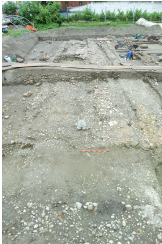
Apparition des niveaux supérieurs de la chaussée romaine constituée de galets et de graviers

en extension n'avait jusqu'alors porté sur cette chaussée dont le tracé coïncide en grande partie avec la route de contournement d'Avenches. Composée de strates compactes de galets et de gravier, régulièrement entretenues par de nouvelles recharges, la voie présente une largeur de près de huit mètres, soit deux à trois mètres de plus que les autres rues de la ville. Légèrement bombée en surface, elle était bordée de part et d'autre de fossés latéraux assurant