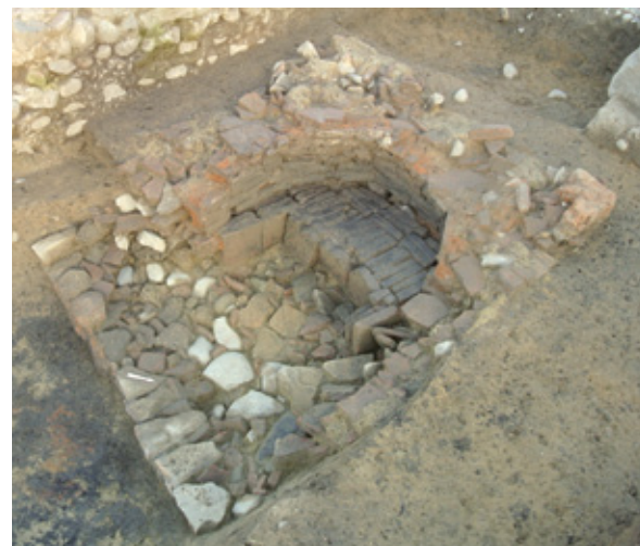
Four (de boulanger?) en grande partie constitué de matériaux en terre cuite en réemploi. Le diamètre de la sole circulaire est d'environ 90 cm

L'agencement des nombreux vestiges présents entre ces deux rues suggère une partition de la surface fouillée en deux parcelles distinctes. Chacune d'elles était occupée, dans sa partie haute, par un petit bâtiment comptant deux ou trois locaux contigus dotés de sols de mortier de chaux lissé. L'une de ces pièces est équipée d'un chauffage par le sol (hypocauste). À l'avant de ces constructions, soit du côté de la voie principale, s'ouvrait une cour où les témoins de diverses activités domestiques et artisanales, métallurgiques en particulier, ont été observés sous la forme de foyers constitués de tuiles en remploi, de fosses-dépotoirs, d'un puits et d'un four très soigneusement agencé, sans doute destiné à la cuisson du pain. Ces divers éléments devaient être en partie abrités par de simples couverts sur poteaux. L'étude du mobilier archéologique issu de ces différents aménagements devrait mieux préciser la nature de cette occupation de même que sa chronologie. Il s'agira notamment d'établir d'une part si la mise en place de la seconde voie conduisant à l'amphithéâtre est contemporaine de